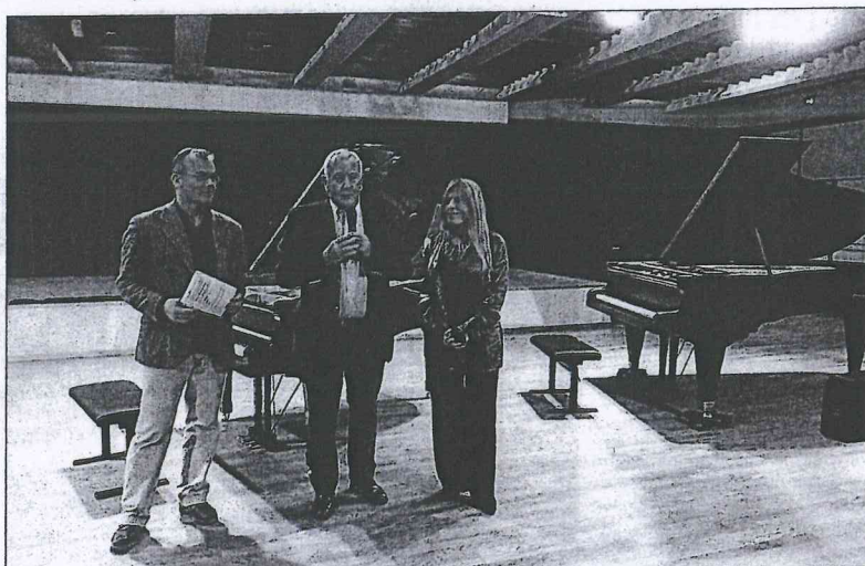
Le piano à queue a servi pour la première fois sur la Presqu'île lors du Tournoi international de musique. Il reste à La Forestière.

L'association Sons d'avril, initiatrice du Cap Ferret music festival de l'été, a lancé à l'occasion du prestigieux Tournoi international de musique début mars un appel aux dons afin d'acquérir un piano à queue. Il s'agit d'un ¼ de queue, d'une taille de 2,25 m, un Gaveau de 1930 refait à neuf en 2005. Son ancien propriétaire a accepté d'attendre pour être réglé... Son prix est de 5.600 €, plus 777 € pour le transport, auxquels il a fallu rajouter 100 € pour l'accorder. Il restera désormais sur la Presqu'île à la salle de La Forestière, grâce à la contribution de quatre « grands » donateurs à au moins 1.000 € chacun : l'association Protection et aménagement de Lège-Cap-Ferret PALCF, Sorbet d'amour, la Lyonnaise des eaux et l'Agence d'architecture Atlantique AAA, plus de nombreux dons individuels pour un total de 850 €. Il servira pour le Cap Ferret music festival et son Académie, mais il sera aussi à disposition pour d'autres concerts et activités musicales organisés sur la commune.