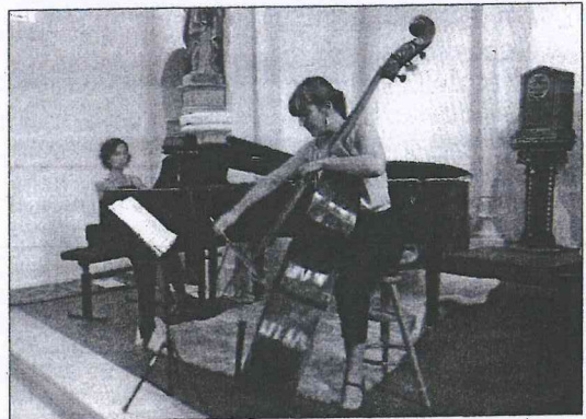
Le tournoi international de musique ou TIM représente chaque année environ 4.000 candidats dans le monde, provenant de 70 pays. Les épreuves finales ont lieu à Rome fin juin.

plusieurs particularités par rapport à la plupart des concours. D'abord, « il n'y a pas de limite d'âge, dit-il. Généralement, les candidats vont jusqu'à 30-35 ans ; là nous avons même eu un nonagénaire... » Ensuite, le programme est libre, alors que la plupart des concours imposent un programme ou un choix parmi certaines œuvres. Ce qui plaît et stimule les musiciens et permet de les juger par rapport à ce qu'ils savent et aiment faire. Et surtout, les vainqueurs, outre un diplôme, sont primés avec des contrats auprès de sociétés de concert amies du concours en Europe, ce qui est « très stimulant » pour eux. Les candidats présélectionnés pour le TIM sont également autorisés à passer directement les épreuves finales du concours Bellan sans passer par les éliminatoires, un autre concours prestigieux créé en 1926. À noter aussi que le ou les meilleurs candidats présélectionnés se verront offrir une bourse pour l'Académie du "Cap Ferret music festival", incluant la participation aux concerts jeunes talents. Outre la musique, le concours comprend la composition et la critique musicale et pour la première fois la poésie, qui sera mise en musique pour les gagnants. Cer-