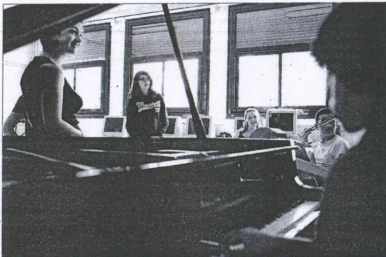
Dans le prolongement des Académies du festival, le Cap Ferret Music Festival organise début mars une présélection du Tournoi international de musique.

En effet, des master class, destinées à des élèves engagés dans une carrière professionnelle, sont orga-