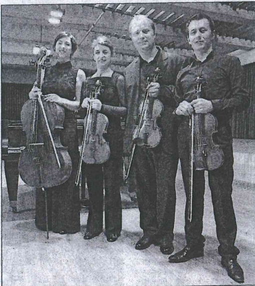
Le quatuor Mascaret est présélectionné pour les finales du TIM à Rome avec le duo Soleil-Cerise. Le premier gagne aussi une bourse pour l'Académie musicale du Cap Ferret, du 7 au 14 juillet. Les inscriptions sont ouvertes.

www.capferretmusicfestival.com . Inscriptions Académie 06.86.26.28.36 et sophie.johnston@ferretfestival.com